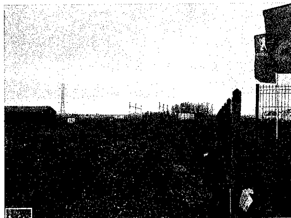
Vue du site après travaux

Madame Stéphanie DUHAMEL directrice de projets de RTE, a fait parvenir par mail le 03 février 2012, une simulation photos (ci-dessous) qui représente la vision du site depuis la rue de Frévent à Avesnes-le-Comte, montrant que les nouveaux ouvrages seront de même hauteur que ceux existants, et que l'impact visuel restera faible. Elle précise, que les poteaux du jeu de barre font 16 mètres et la poutre horizontale 13 mètres de hauteur par rapport au sol. (Annexe7).